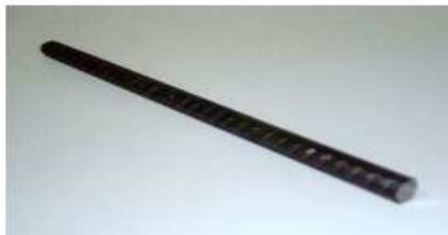
Barra de aço de construção de 8 mm de diâmetro

11. Para que possa ser realizado o teste de carga da ponte, ela deverá ter fixada na região correspondente ao centro do vão livre, no sentido transversal ao seu comprimento e no mesmo nível das extremidades apoiadas, uma barra de aço de construção de 8 mm de diâmetro e de comprimento igual à largura da ponte. A carga aplicada será transmitida à ponte através desta barra. O peso da barra não será contabilizado no peso total da ponte, como descrito no item 4.