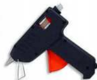
Cola Quente em pistola