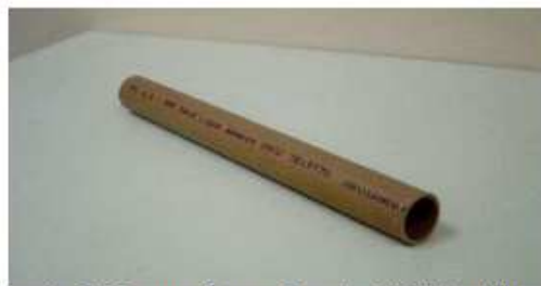
Tubo de PVC para água fria de 1/2" de diâmetro

7. Na parte inferior de cada extremidade da ponte deverá ser fixado um tubo de PVC para água fria de 1/2" de diâmetro e 20 cm de comprimento para facilitar o apoio destas extremidades sobre as faces superiores (planas e horizontais) de dois blocos colocados no mesmo nível. O peso dos tubos de PVC não será contabilizado no peso total da ponte, como descrito no item 4.